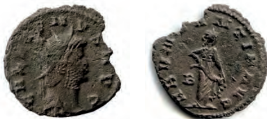
4- Antoniniano in lega di argento povero di Gallieno, del 259-268, della zecca di Roma. Al Rovescio è rappresentata la personificazione della Abundantia , che svuota la cornucopia. N. Cat. 37