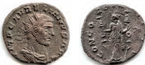
19- Antoniniano in lega di argento di Aureliano, del 270-275, della zecca di Siscia . Al Rovescio è la personificazione della Concordia , con due insegne militari nelle mani, simbolica della pacificazione dell'Impero. N. Cat. 993