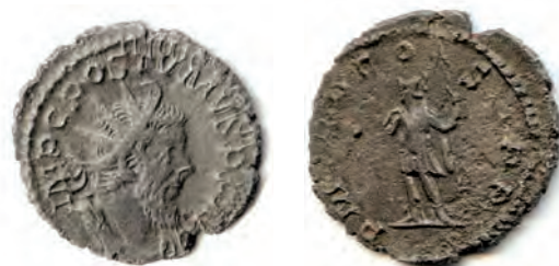
20- Antoniniano in lega di argento di Postumo, imperatore della Gallia (l'attuale Francia), che si è resa indipendente, del 260, della zecca di Lugdunum (Lione). Al Rovescio è Mars , con lo scettro e il globo, simbolo del potere imperiale. N. Cat. 999