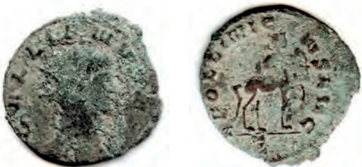
6- Antoniniano in lega di argento povero di Gallieno, del 259-268, della zecca di Roma. Al Rovescio è rappresentato il segno zodiacale di Gallieno, il Sagittario, sotto forma di Centauro, che tende l'arco. N. Cat. 89