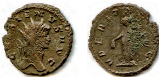
10- Antoniniano in lega di argento povero di Gallieno, del 259-268, della zecca di Roma. Al Rovescio è rappresentata la personificazione dell' Uberitas (la fecondità della terra), con la cornucopia e un grappolo d'uva. N. Cat. 386