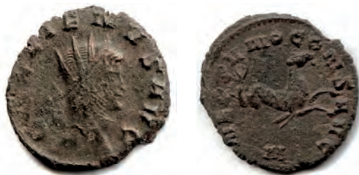
9- Antoniniano in lega di argento povero di Gallieno, del 259-268, della zecca di Roma. Al Rovescio è rappresentato un Ippocampo, del corteggio di Nettuno, del quale si invoca la protezione sul mare. N. Cat. 295