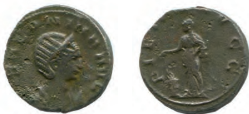
3- Antoniniano in lega di argento povero di Salonina, moglie di Gallieno, del 256-257, della zecca di Roma. Al Rovescio è rappresentata la personificazione della Pietas (il sentimento religioso) che sacrifica su un altare. N. Cat. 9