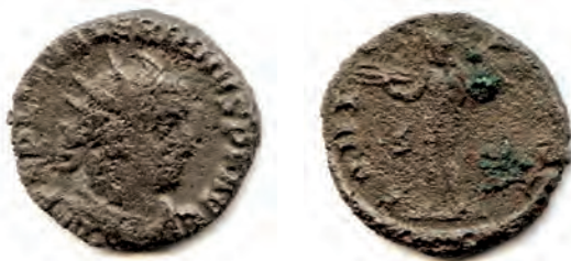
1- Antoniniano in lega di argento povero di Valeriano, del 255-256, della zecca di Roma. Al Rovescio è rappresentato Giove “ conservator ” con la scettro e il fulmine, invocato a protezione dell’Imperatore. N. Cat. 2.