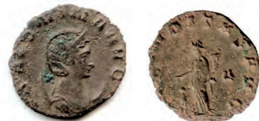
11- Antoniniano in lega di argento povero di Salonina, moglie di Gallieno, del 259-268, della zecca di Roma. Al Rovescio è rappresentata la personificazione della Fecunditas (la fertilità dell'imperatrice, che ha dato un erede all'imperatore, invito alla natalità della popolazione, che andava declinando) con la cornucopia e un bimbo. N. Cat. 478