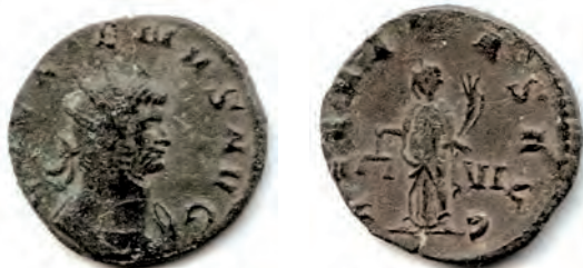
5- Antoniniano in lega di argento povero di Gallieno, del 259-268, della zecca di Roma. Al Rovescio è rappresentata la personificazione della Aequitas (la giustizia fiscale che genera ricchezza) che stringe la cornucopia. N. Cat. 63