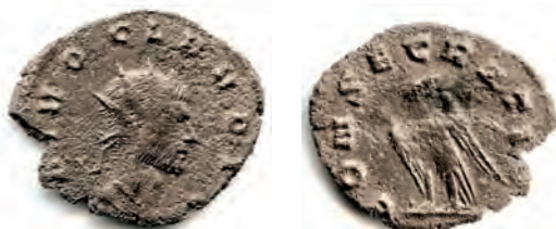
17- Antoniniano in lega di argento in memoria di Claudio II, divinizzato, successivo al 270, della zecca di Roma. Al Rovescio è l'aquila, attributo di Giove, che ha portato Claudio in cielo. N. Cat. 965