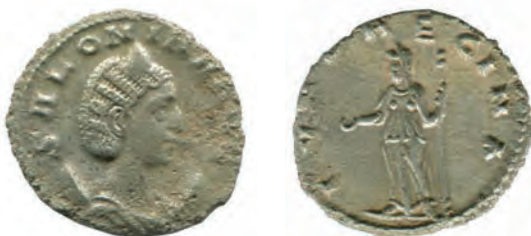
12- Antoniniano in lega di argento povero di Salonina, moglie di Gallieno, del 259-268, della zecca di Roma. Al Rovescio è rappresentata Iuno Regina , protettrice dell'imperatrice, con lo scettro e con la patera per le libazioni. N. Cat. 500