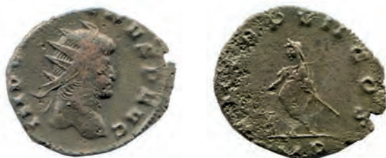
2- Antoniniano in lega di argento povero di Gallieno, del 259, imperatore insieme al Padre Valeriano, della zecca di Milano. Al Rovescio è rappresentato Gallieno togato che sacrifica su un altare. N. Cat. 5