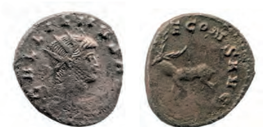
8- Antoniniano in lega di argento povero di Gallieno, del 259-268, della zecca di Roma. Al Rovescio è rappresentato un Cervo, animale sacro a Diana cacciatrice, della quale si chiede la protezione nella leggenda. N. Cat. 127