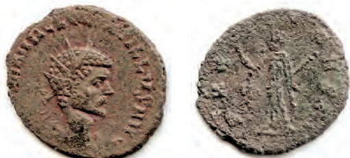
18- Antoniniano in lega di argento di Quintillo, fratello di Claudio II, imperatore per pochi mesi, del 270, della zecca di Roma. Al Rovescio è Pax , con lo scettro e il ramo d'olivo. N. Cat. 984