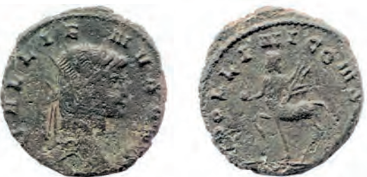
7- Antoniniano in lega di argento povero di Gallieno, del 259-268, della zecca di Roma. Al Rovescio è rappresentato un Centauro (stemma sulle insegne di una legione romana) con il globo e un trofeo militare. N. Cat. 106