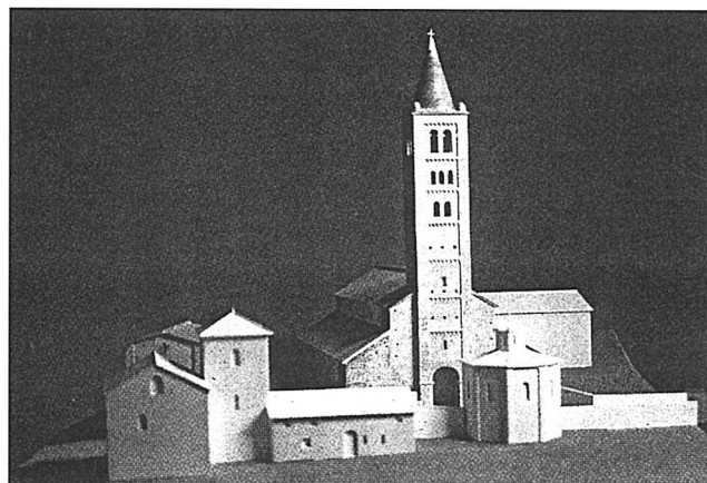
155 - Iseo, mostra “Archeologia urbana e edilizia storica in Iseo” L'area della Pieve nel XIII secolo. Plastico ricostruttivo