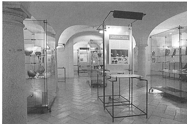
154 - Milano, mostra “Veteres incolae manentes” Particolare di un settore dell'allestimento